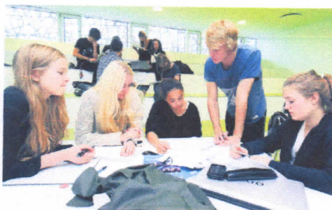
Matematikcenter har også lektiecaféer på andre skoler - her på Zahles i København.